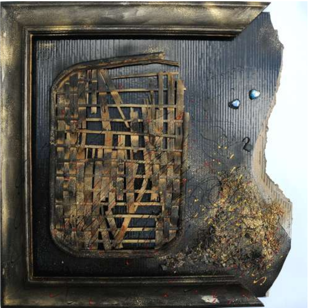
VERSO .... - (75 x 78 cm)

Ho apprezzato il tuo percorso e confesso che ne sono rimasta sorpresa e ammirata. Hai richiamato alla mente il periodo in cui frequentavo il tuo laboratorio ed i consigli e gli stimoli che, sempre in punta di piedi, ma efficaci, di volta in volta suggerivi.