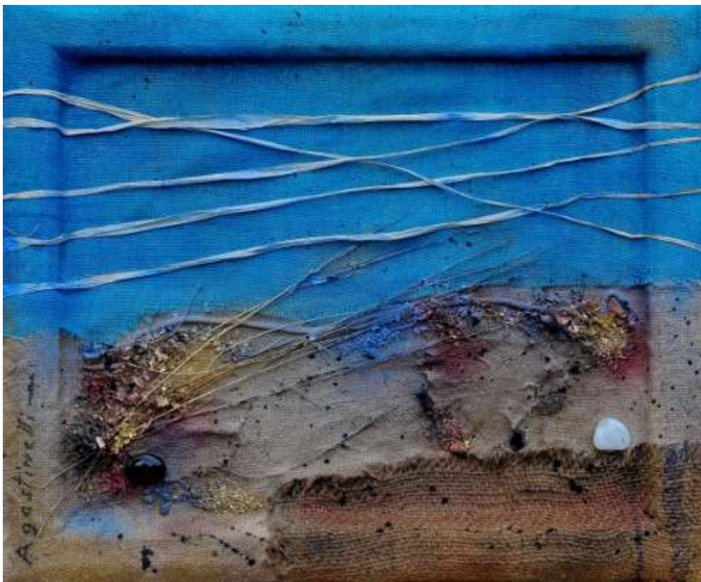
PIETRE - (58 x 48 cm)

Sono cresciuta tra le tele, i gessetti e l'odore della pittura ad olio, ma non mi stanco mai di guardare i tuoi capolavori, capaci sempre di stupirmi e di emozionarmi.