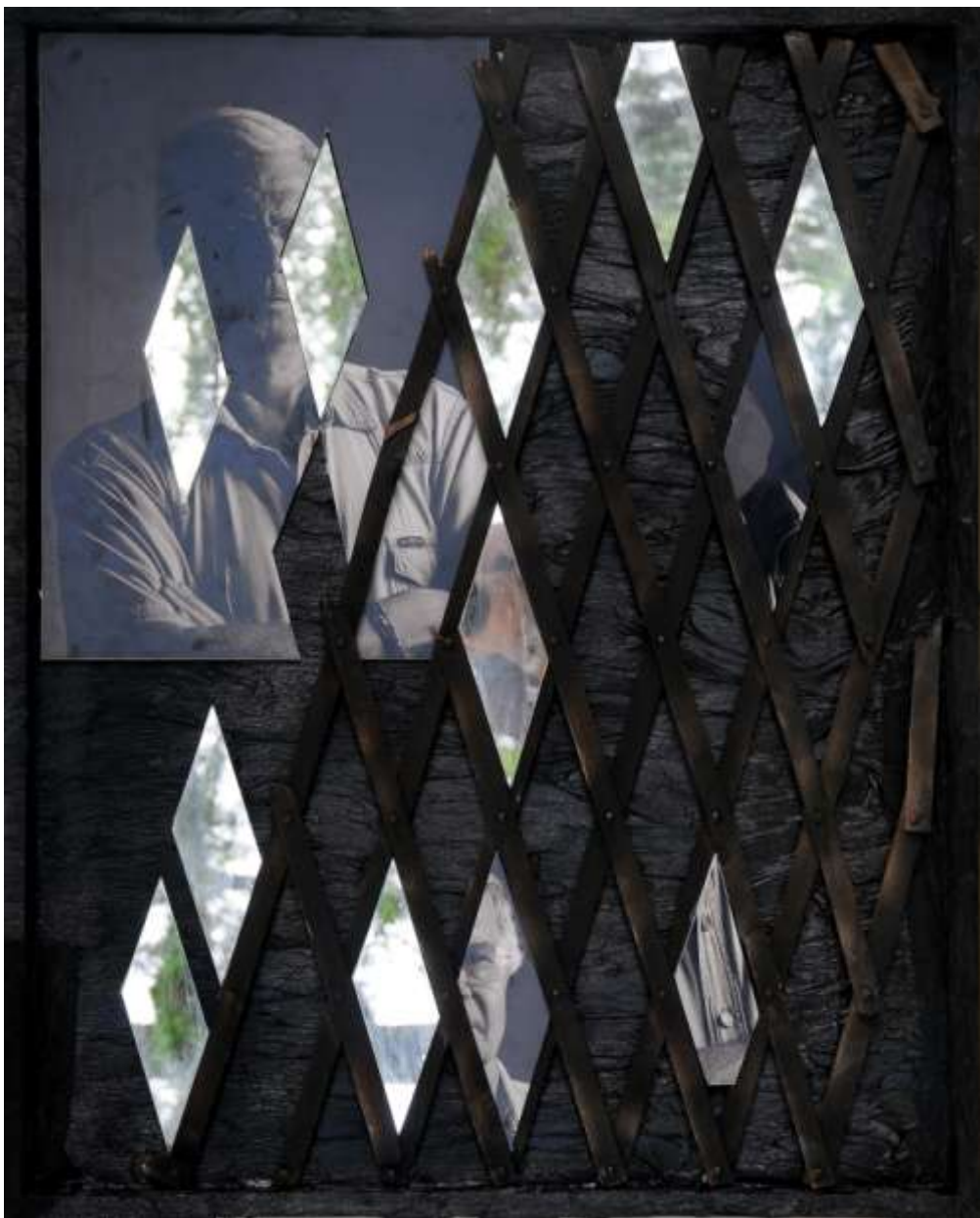
IDEA? .... FOTO! - (77 x 107 cm)