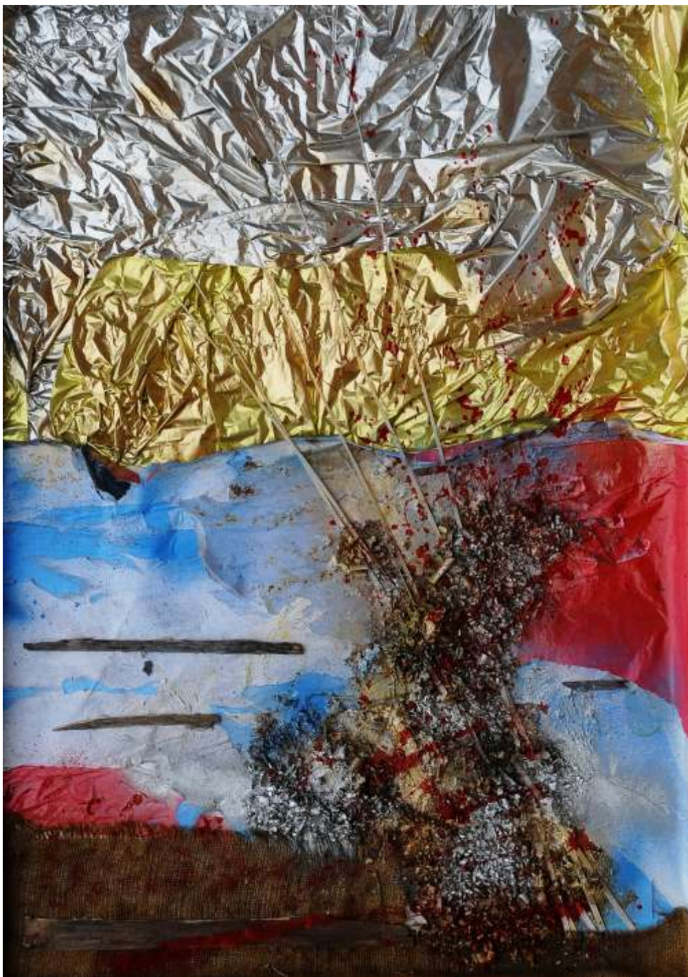
ARGENTO - particolare (77 x 107 cm)