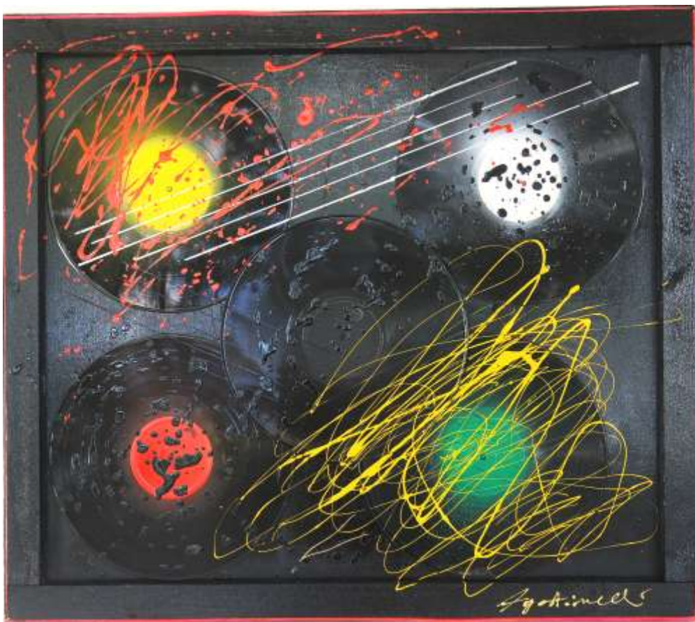
33 GIRI - (84 x 74 cm)

Caro fratello in arte, la cosa più bella che continua ancora a stupirmi, è l'energia che sprigiona da te quando giocando con la materia e il colore, ti diverti a trasformarla e a darle una nuova vita.