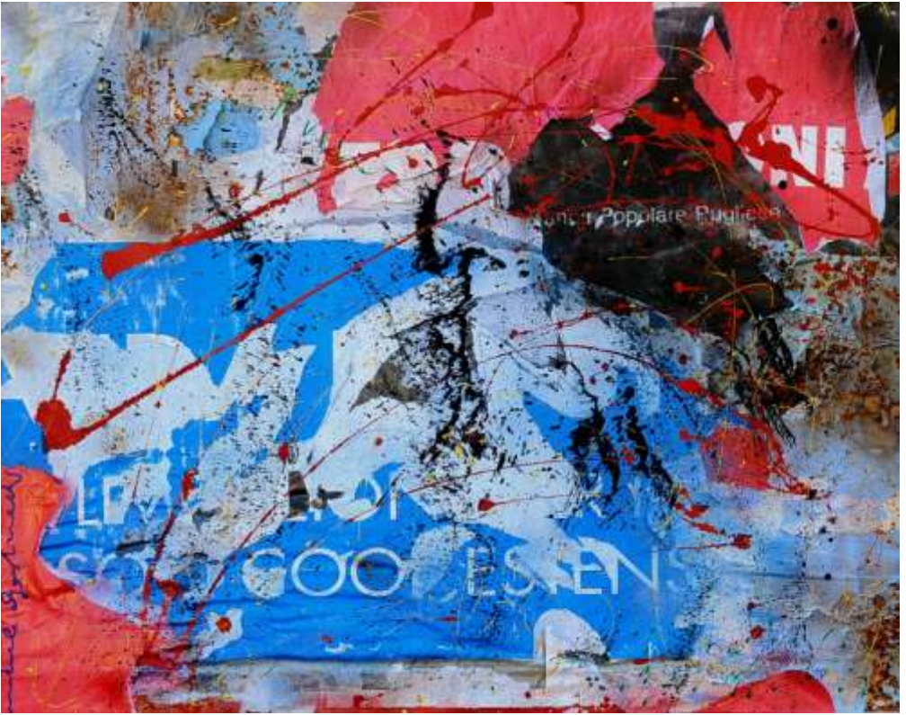
STRAPPI - (100 x 70 cm)