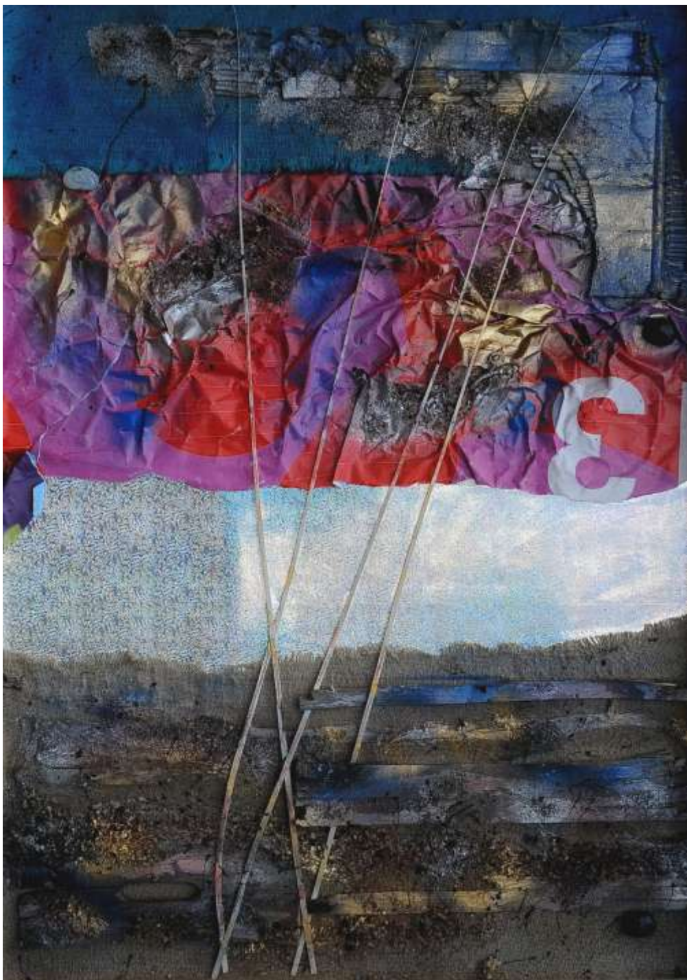
RIFLESSO - particolare (77 x 107 cm)