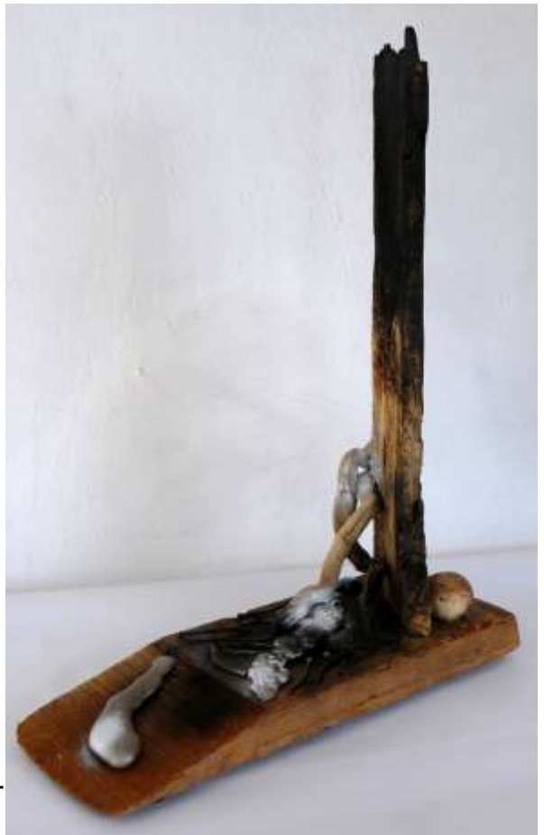
REMEMBER (Peschici) - (20 x 50 x 70 cm)