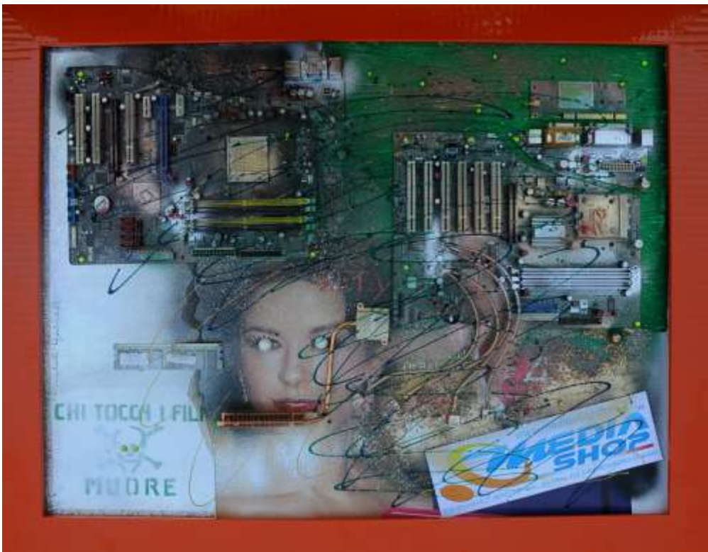
MEDIA ..... - (100 x 70 cm)

Nei tuoi lavori si coglie l'azzurro della Speranza.