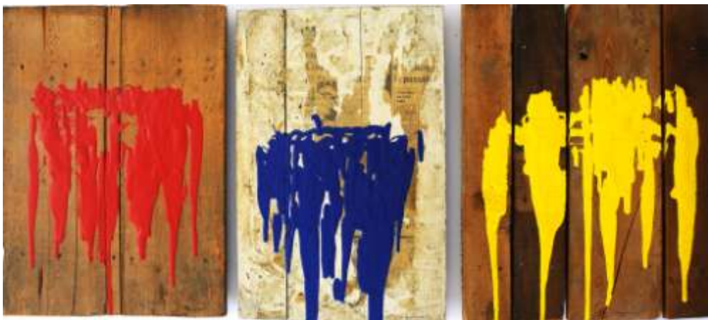
TRIS - (3 x 40 x 60 cm)